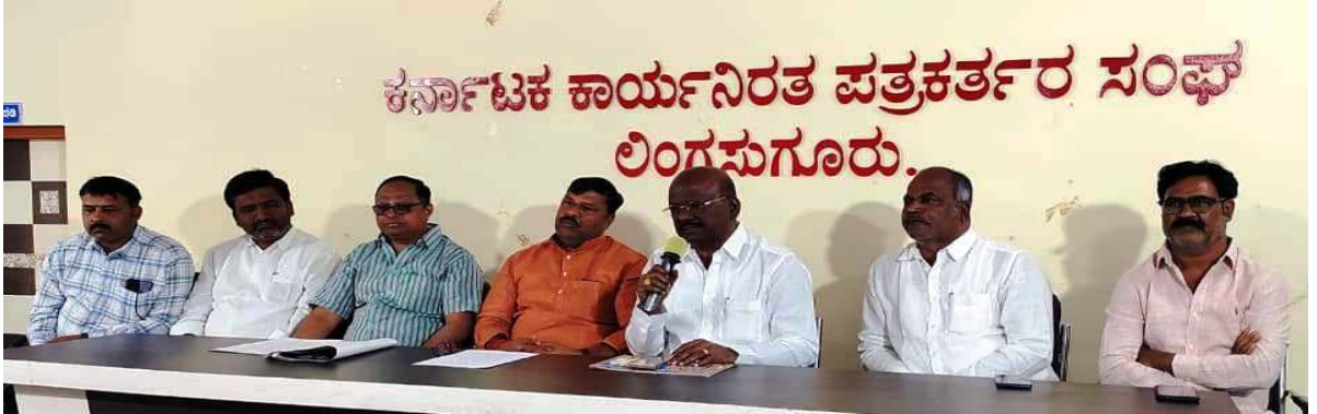
ಕರ್ನಾಟಕ ಕಾರ್ಯನಿರತ ಪತ್ರಕರ್ತರ ಸಂಘ ಲಿಂಗಸೂಗೂರು.

ನನ್ನ ಮಾತುಕತೆಯಲ್ಲಿ ಅಕ್ರಮ ಸಕ್ರಮಕ್ಕೆ 1200 ಅರ್ಜಿ ಗಳು