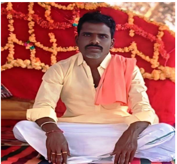
ಪಾತ್ರರಾಗಬೇಕೆಂದು ಸ್ವಾಮಿಗಳು ಸ್ವಾಗತ ಕೋರಿದರು.