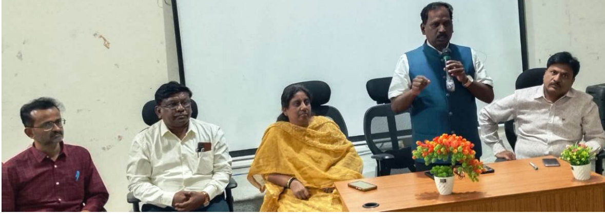
ಜನತೆಗೆ ಗುಣಮಟ್ಟದ ಆರೋಗ್ಯ ಸೇವೆ ನೀಡಲು ತರಬೇತಿಯ ಮಹತ್ವ ಪಡೆದುಕೊಳ್ಳಬೇಕು ಎಂದರು.

ಕರ್ನಾಟಕ ಸರ್ಕಾರವು ಆರೋಗ್ಯ ಸೇವೆ-ಮನೆ ಬಾಗಿಲಿಗೆ ಎಂಬ ಧ್ಯೇಯದಡಿ ಜೀವನ ಶೈಲಿಯ ಖಾಯಿಲೆಗಳಾದ ರಕ್ತದೊತ್ತಡ, ಸಕ್ಕರೆ ಖಾಯಿಲೆ ಜೊತೆ ಜೊತೆಗೆ ಕ್ಯಾನ್ಸರ್ ಪತ್ತೆ ಹಾಗೂ ಚಿಕಿತ್ಸೆ ಸೇರಿದಂತೆ 14 ವಿವಿಧ ಆರೋಗ್ಯ ಸೇವೆಗಳನ್ನು ಗ್ರಾಮೀಣ ಪ್ರದೇಶಗಳಲ್ಲಿ ಒದಗಿಸಿದಂತೆ ನಗರದ ಪ್ರದೇಶದ ಅರ್ಥಿಕ ತೊಂದರೆಯುಳ್ಳ ಜನತೆಗೂ ಸಹ ಶೀಘ್ರದಲ್ಲಿಯೇ ಒದಗಿಸಲು ನಿರ್ಧರಿಸಲಾಗಿದ್ದು, ಈ ದಿಶೆಯಲ್ಲಿ ಎಲ್ಲರೂ