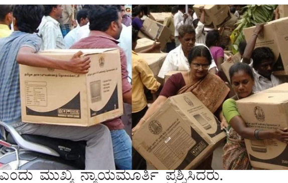
ಎಂದು ಮುಖ್ಯ ನ್ಯಾಯಮೂರ್ತಿ ಪ್ರತಿಪಾದಿಸಿದರು.

ನವದೆಹಲಿ,ಫೆ19-ಚುನಾವಣೆ ಸಮೀಪಿಸಿದಾಗ ರಾಜ್ಯ ಸರ್ಕಾರಗಳು ಘೋಷಿಸುವ 'ಉಚಿತ ಯೋಜನೆಗಳು' ಹಾಗೂ ಉಚಿತ ನೇರ ಹಣ ವರ್ಗಾವಣೆ (ಡೈರೆಕ್ಟ್ ಕ್ಯಾಶ್ ಟ್ರಾನ್ಸ್‌ಫರ್) ಕುರಿತು , ಸುಪ್ರೀಂಕೋರ್ಟ್‌ಗೆ ಅರ್ಜಿ ಸಲ್ಲಿಸಿ ಅರ್ಜಿ ಸಲ್ಲಿಸಿದ. ಇಂತಹ 'ಪ್ರೀಬೀಸ್' ಸಂಸ್ಥೆ ದೇಶದ ದೀರ್ಘಕಾಲಿಕ ಅಭಿವೃದ್ಧಿಗೆ ಅಡ್ಡಿಯಾಗಬಹುದು ಎಂದು ನ್ಯಾಯಾಲಯ ಗಂಭೀರ ಎಚ್ಚರಿಕೆ ನೀಡಿದೆ. ಮುಖ್ಯ ನ್ಯಾಯಮೂರ್ತಿ ಸೂರ್ಯಕಾಂತ್ ಅವರ ನೇತೃತ್ವದ ಪೀಠದ ನ್ಯಾಯಮೂರ್ತಿಗಳಾದ ಜೋಮಾಲ್ಯಾ ಭಗೀಚಿ ಹಾಗೂ ವಿಪುಲ್ ಪಾಂಚೋಗಿ ಅವರು ತಮಿಳುನಾಡು ವಿಧ್ಯುತ್ ವಿತರಣೆ ಕಂಪನಿ ಸಲ್ಲಿಸಿದ್ದ ಅರ್ಜಿಯ ವಿಚಾರಣೆ ನಡೆಸುವ ಸಂದರ್ಭದಲ್ಲಿ ಈ ಮೌಖಿಕ ಅಭಿಪ್ರಾಯಗಳನ್ನು ವ್ಯಕ್ತಪಡಿಸಿತು.