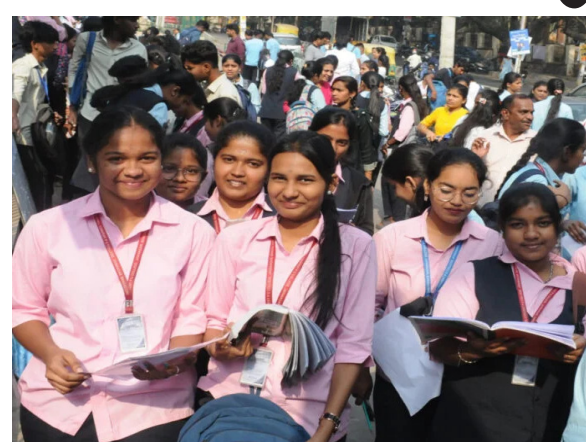
ಆತ್ಮವಿಶ್ವಾಸದಿಂದ ಪರೀಕ್ಷೆ ಬರೆಯಿರಿ. ಉತ್ತಮ ಅಂಕಗಳ ಜತೆಗೆ ಉಜ್ವಲ ಭವಿಷ್ಯವು ನಿಮ್ಮದಾಗಲಿ ಎಂದು ಹಾರೈಸಿದ್ದಾರೆ.

ಬೆಂಗಳೂರು, ಫೆ.28- ವಿದ್ಯಾರ್ಥಿ ಜೀವನದ ಪ್ರಮುಖ ಕಾಲಘಟ್ಟವೆಂದೇ ಹೇಳಲಾಗುವ ದ್ವಿತೀಯ ಪರೀಕ್ಷೆಗಳು ರಾಜ್ಯಾದ್ಯಂತ ಆರಂಭವಾಗಿದ್ದು, ಮೊದಲ ದಿನ ಪರೀಕ್ಷೆಗಳು ಸುಸೂತ್ರವಾಗಿ ನಡೆದಿವೆ. ರಾಜ್ಯದ ಪದವಿ ಪೂರ್ವ ಶಿಕ್ಷಣ ಇಲಾಖೆ ನಡೆಸುವ ದ್ವಿತೀಯ ಪರೀಕ್ಷೆಗೆ ಸುಮಾರು 7 ಲಕ್ಷ ವಿದ್ಯಾರ್ಥಿಗಳು ನೋಂದಾಯಿಸಿಕೊಂಡಿದ್ದು, ಪರೀಕ್ಷೆಯ ಮೊದಲ ದಿನವಾದ ಇಂದು ಕನ್ನಡ ಮತ್ತು ಅರೆಬಿಕ್ ವಿಷಯಗಳ ಪರೀಕ್ಷೆ ನಡೆಯಿತು. ಆರಂಭವಾಗಿರುವ ದ್ವಿತೀಯ ಪರೀಕ್ಷೆಗೆ ಮಾರ್ಚ್ 17ರ ವರೆಗೂ ನಡೆಯಲಿದ್ದು, ಪರೀಕ್ಷೆಗಾಗಿ ರಾಜ್ಯಾದ್ಯಂತ 1217 ಕೇಂದ್ರಗಳನ್ನು ಆರಂಭಿಸಲಾಗಿದೆ.