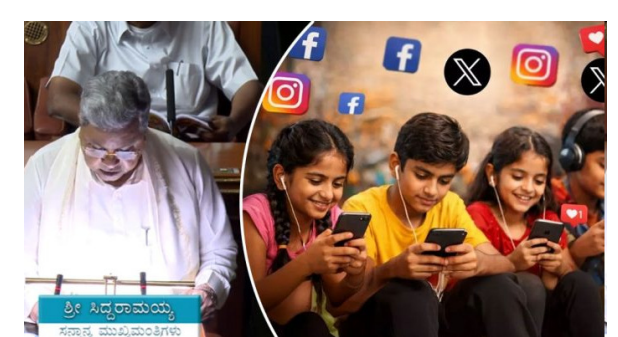
ಮನರಂಜನೆಯ ಹೆಸರಿನಲ್ಲಿ ನಡೆಯುವ ಸಮಯ ವ್ಯರ್ಥವನ್ನು ತಡೆಯಲು ಈ ಕ್ರಮ ಪೂರಕವಾಗಿದೆ. ಕರ್ನಾಟಕ ಸರ್ಕಾರವು ತಂತ್ರಜ್ಞಾನದ ಲಾಭ ಮತ್ತು ಹಾನಿಗಳ ನಡುವೆ ಸಮತೋಲನ ಕಾಯ್ದುಕೊಳ್ಳಲು ಈ ಹೆಜ್ಜೆ ಇಟ್ಟಿದೆ. ಇದು ಘೋಷಣೆಯಾಗಿ ಉಳಿಯದೆ, ಕಟ್ಟುನಿಟ್ಟಾಗಿ ಜಾರಿಗೆ ಬಂದರೆ ರಾಜ್ಯದ ಶೈಕ್ಷಣಿಕ ಕ್ಷೇತ್ರದಲ್ಲಿ ದೊಡ್ಡ ಬದಲಾವಣೆ ನಿರೀಕ್ಷಿಸಬಹುದು.

ಮಕ್ಕಳ ಮೆದುಳಿನ ಬೆಳವಣಿಗೆಯ ಹಂತದಲ್ಲಿ ಸೋಷಿಯಲ್ ಮೀಡಿಯಾದ ಪ್ರಚೋದನೆ ಅಪಾಯಕಾರಿ. ಈ ನಿಷೇಧವು ಮಕ್ಕಳನ್ನು ಸ್ವಜನಾತಕ ಚಟುವಟಿಕೆಗಳತ್ತ ಮರಳುವಂತೆ ಮಾಡುತ್ತದೆ ಎನ್ನುವುದು ಮನಶ್ಚಾಸ್ತ್ರಜ್ಞರು ಮತ್ತು ಶಿಕ್ಷಣ ತಜ್ಞರ ಅಭಿಪ್ರಾಯವಾಗಿದೆ. ತಂತ್ರಜ್ಞಾನವನ್ನು ಮಾತ್ರ ಸೀಮಿತಗೊಳಿಸಿ,