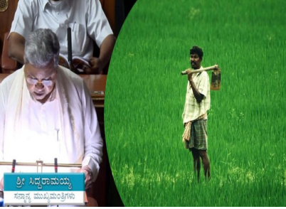
ಬೆಂಗಳೂರು, ಮಾ.6- ಧರಣಿಯ ಕೃಷಿ ಶುದ್ಧವಾಗಿಯಲ್ಲದೆ, ಸಸಿ ಶುದ್ಧವಿಲ್ಲ ಎಂಬ ವಚನಕಾರ ಶಿವಲಿಂಗ ಮಂಚಣ್ಣ ಸಾಲುಗಳೊಂದಿಗೆ ಕೃಷಿ ಬಜೆಟ್ ಮಂಡಿಸಿದ ಮುಖ್ಯಮಂತ್ರಿ ಸಿದ್ದರಾಮಯ್ಯ ಅವರು, ರೈತ ಸಮುದಾಯದ ಕರ್ನಾಟಕ ಸಮುದಾಯದವರ ಎಂಬ ಆಶಯದೊಂದಿಗೆ ಕೃಷಿ ಕ್ಷೇತ್ರಕ್ಕೆ ಹಲವು ವಹಿವಾಟು ಯೋಜನೆಗಳನ್ನು ಬಜೆಟ್‌ನಲ್ಲಿ ಘೋಷಿಸಿದ್ದಾರೆ.

ಬಜೆಟ್ ಹೈಲೈಟ್ : ಕೃಷಿ ಕ್ಷೇತ್ರಕ್ಕೆ ಸಿಕ್ಕಿದ್ದೇನು..?