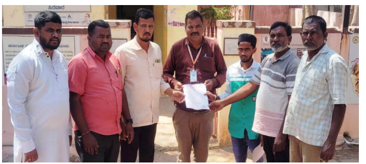
ತೆಗೆದುಕೊಳ್ಳುವ ಮೊದಲು ಸ್ಥಳೀಯರ ಮತ್ತು ನಾಗರಿಕ ಸಂಘಟನೆಗಳ ಅಭಿಪ್ರಾಯವನ್ನು ಪಡೆಯುವುದು ಅವಶ್ಯಕ. ಆದರೆ, ಈ ಪ್ರಕ್ರಿಯೆಯಲ್ಲಿ ಜನರ ಹಿತಾಸಕ್ತಿಯನ್ನು ನಿರ್ಲಕ್ಷಿಸಲಾಗಿದೆ ಎಂದು ಆರೋಪಿಸಲಾಗಿದೆ. 2ನೇ ಪುಟಕ್ಕೆ

ಧ್ಯಯದ ದಾರಿ ಸಿರವಾರ: ಪ್ರಸ್ತಾವಿತ ಸಿಂಧನೂರು ಜಿಲ್ಲೆಗೆ ಸಿರವಾರ ತಾಲೂಕನ್ನು ಸೇರ್ಪಡೆಗೊಳಿಸುವ ಸರ್ಕಾರದ ನಿರ್ಧಾರವನ್ನು ಕೈಬಿಡಬೇಕೆಂದು ಆಗ್ರಹಿಸಿ, ಭಾರತೀಯ ಮಾನವ ಹಕ್ಕುಗಳ ಪರಿಷತ್ ವತಿಯಿಂದ ಇಂದು ಸ್ಥಳೀಯ ತಹಶೀಲ್ದಾರ್ ಅವರ ಮುಖಾಂತರ ಜಿಲ್ಲಾಧಿಕಾರಿಗಳಿಗೆ ಮನವಿ ಪತ್ರ ಸಲ್ಲಿಸಲಾಯಿತು. ಪ್ರಮುಖ ಅಂಶಗಳು: ಆಡಳಿತಾತ್ಮಕ ತೊಂದರೆ: ಸಿರವಾರವನ್ನು ಸಿಂಧನೂರು ಜಿಲ್ಲೆಗೆ ಸೇರಿಸುವುದರಿಂದ ಸಾರ್ವಜನಿಕರಿಗೆ ಆಡಳಿತಾತ್ಮಕ ಕೆಲಸಗಳಿಗಾಗಿ ದೂರದ ಪ್ರಯಾಣ ಬೆಳೆಸಬೇಕಾಗುತ್ತದೆ ಮತ್ತು ಇದರಿಂದ ಸಾಮಾನ್ಯ ಜನರಿಗೆ ತೊಂದರೆಯಾಗಲಿದೆ ಎಂದು ಪರಿಷತ್ ಆತಂಕ ವ್ಯಕ್ತಪಡಿಸಿದೆ. ಜನರ ಆಶೋತ್ತರ: ಯಾವುದೇ ನಿರ್ಧಾರ