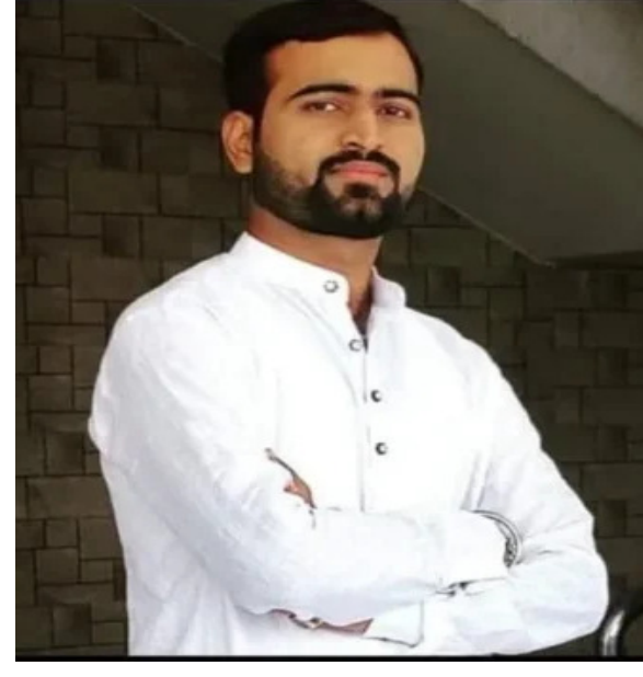
ಕೇಂದ್ರಗಳನ್ನು ಸ್ಥಾಪಿಸುವುದು ಕಾಲದ ಅಗತ್ಯವಾಗಿದೆ ಎಂದು ಅವರು ಅಭಿಪ್ರಾಯಪಟ್ಟರು.

ಇದಕ್ಕೂ ಜೊತೆಗೆ ನಗರದ ರೈಲ್ವೆ ನಿಲ್ದಾಣ, ಬಸ್ ನಿಲ್ದಾಣ, ಪ್ರಮುಖ ಮಾರುಕಟ್ಟೆ ಪ್ರದೇಶಗಳು, ಸರ್ಕಾರಿ ಕಚೇರಿಗಳ ಮುಂಭಾಗ ಹಾಗೂ ಜನಸಂದಣಿ ಹೆಚ್ಚಿರುವ ಸ್ಥಳಗಳಲ್ಲಿ ಶುದ್ಧ ಕುಡಿಯುವ ನೀರಿನ ಅರವಟ್ಟಿಗೆಗಳನ್ನು ತುರ್ತಾಗಿ ಪ್ರಾರಂಭಿಸಬೇಕಾಗಿದೆ. ಸಾರ್ವಜನಿಕರಿಗೆ ಸುಲಭವಾಗಿ ಕುಡಿಯುವ ನೀರು ದೊರೆಯುವಂತೆ ತಾತ್ಕಾಲಿಕ ನೀರಿನ