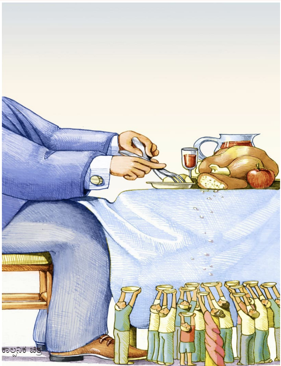
ಜನರು ಹಸಿವಿನಿಂದ ಬಳಲುತ್ತಿದ್ದಾರೆ. ಇದನ್ನು ನಿವಾರಿಸಲು ಸಮಾನ ಅವಕಾಶಗಳು ಮತ್ತು ಸಂಪನ್ಮೂಲಗಳ ನ್ಯಾಯಸಮ್ಮತ ಹಂಚಿಕೆ ಅಗತ್ಯ.

ಮಾನವೀಯ ಮೌಲ್ಯಗಳ ದೃಷ್ಟಿಯಿಂದ ನೋಡಿದರೆ ಹಸಿವು ಕೇವಲ ದೇಹದ ಅಗತ್ಯವಲ್ಲ; ಅದು ಸಾಮಾಜಿಕ ನ್ಯಾಯದ ಪ್ರಶ್ನೆಯೂ ಆಗಿದೆ. ಪ್ರತಿಯೊಬ್ಬ ಮಾನವನಿಗೂ ಹೊಟ್ಟೆತುಂಬ ಆಹಾರ ಸಿಗಬೇಕು ಎಂಬುದು ಮೂಲಭೂತ ಹಕ್ಕು. ಯಾರೂ ಹಸಿವಿನಿಂದ ನರಳಬಾರದು. ಆದರೆ ವಾಸ್ತವದಲ್ಲಿ ಇನ್ನೂ ಅನೇಕ