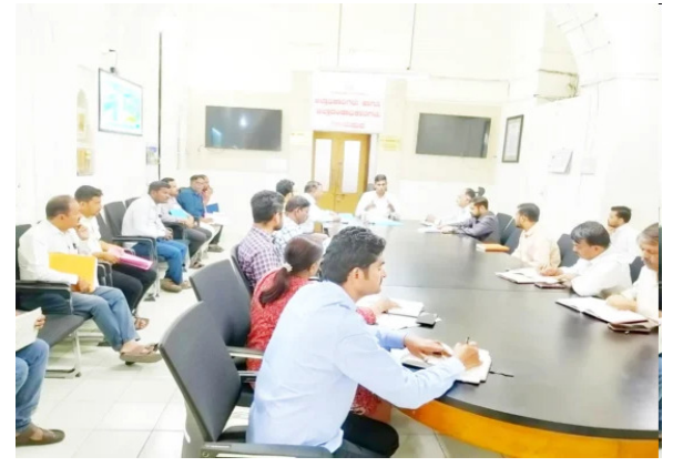
2025-26 ನೇ ಸಾಲಿನ ಖಿರಟಟ ಯೋಜನೆಯಡಿ ದಾಖ್ತೆ ದಾಳಿಬೆ ಹಾಗೂ ಲಿಂಬೆ ಬೆಳೆಗಳಿಗೆ ಅಲಿಕ್ಕಲು ಮಳೆಯಿಂದಾಗಿ ಬೆಳೆಹಾನಿ ಸಂಭವಿಸಿದ್ದಲ್ಲಿ, ವಿಮೆ ಮಾಡಿಸಿದ ಬೆಳೆಯ ವಿವರಗಳನ್ನು ಹಾಗೂ ಮಾಹಿತಿಯನ್ನು 72 ಗಂಟೆಗಳೊಳಗೆ ಅಗ್ರಿಕಲ್ಚರ್ ಇನ್ಸೂರೆನ್ಸ್ ಕಂಪನಿ ಆಪ್ ಇಂಡಿಯಾ ಲಿ. ರವರಿಗೆ ಖಿರಟಟ ಈಡಿಜಿಜಿ ಓಣಿಟಿಜಿಡಿ 1800 425 6678 ಗೆ ಕರೆ ಮಾಡಿ ರೈತರು ಮಾಹಿತಿ ನೀಡಬಹುದಾಗಿದೆ ಎಂದರು. ವಿಮಾ ಕಂಪನಿಯ ಅಧಿಕಾರಿಗಳು ಹಾಗೂ ಎಲ್ಲಾ ಇಲಾಖಾ ಅಧಿಕಾರಿಗಳು 3 ದಿನಗಳೊಳಗೆ ಜಂಟಿ ಸಮೀಕ್ಷೆ ಕೈಗೊಂಡು ವರದಿ ನೀಡುವಂತೆ ಜಿಲ್ಲಾಧಿಕಾರಿಗಳು ಸೂಚಿಸಿದರು.

ಕೃಷಿ, ತೋಟಗಾರಿಕೆ ಹಾಗೂ ಕಂದಾಯ ಇಲಾಖೆ ಅಧಿಕಾರಿಗಳು ಹಾಗೂ ಬೆಳೆ ವಿಮಾ ಕಂಪನಿಯ ಅಧಿಕಾರಿಗಳೊಂದಿಗೆ ಜಿಲ್ಲಾಧಿಕಾರಿ ಅಧ್ಯಕ್ಷತೆಯಲ್ಲಿ ನಡೆದ ಸಭೆಯಲ್ಲಿ ಅವರು ಈ ಸೂಚನೆ ನೀಡಿದರು. ಕಂದಾಯ, ಕೃಷಿ ಹಾಗೂ ತೋಟಗಾರಿಕೆ ಇಲಾಖೆ ಅಧಿಕಾರಿಗಳ ತಂಡ ರಚಿಸಿ ಹಾನಿಗೊಳಗಾದ ಕ್ಷೇತ್ರಗಳಿಗೆ ಭೇಟಿ ನೀಡಿ ನಿಖರವಾದ ಸಮೀಕ್ಷೆ ಕೈಗೊಂಡು 3 ದಿನಗಳೊಳಗೆ ಜಂಟಿ ಸಮೀಕ್ಷೆ ನಡೆಸಿ ವರದಿಯನ್ನು ನೀಡಬೇಕು ಎಂದು ಸೂಚಿಸಿದರು. ಇತ್ತೀಚಿನ ದಿನಗಳಲ್ಲಿ ಬಿದ್ದ ಮಳೆ, ಗಾಳಿ ಹಾಗೂ ಅಲಿಕ್ಕಲು ಮಳೆಯಿಂದಾಗಿ ಕೃಷಿ ಬೆಳೆ ಹಾನಿಗೊಳಗಾದ ರೈತರು ಬೆಳೆ ವಿಮೆ ಮಾಡಿಸಿದ್ದರೆ ಅಂತಹ ರೈತರು ಮುಂದಿನ 3 ದಿನಗಳೊಳಗೆ (ಮುಂದಿನ 72 ಗಂಟೆಗಳೊಳಗೆ) ಓರಿಯಂಟಲ್ ಜನರಲ್ ಇನ್ಸೂರೆನ್ಸ್ ಕಂಪನಿ ಖಿರಟಟ ಈಡಿಜಿಜಿ ಓಣಿಟಿಜಿಡಿ 1800 425 6678 ಗೆ ಕರೆ ಮಾಡಿ ವೈಯಕ್ತಿಕ ಸ್ಥಳ ನಿರ್ದಿಷ್ಟ ವಿಮೋಚನಗಳ (ಉಪವಿಮೆ) ಕುರಿತು ದೂರು ದಾಖಲಿಸಬಹುದಾಗಿದೆ ಎಂದು ಜಿಲ್ಲಾಧಿಕಾರಿಗಳು ಸೂಚಿಸಿದರು.