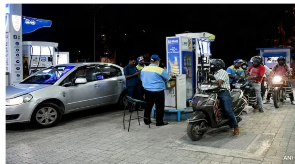
ಬತ್ತಡ ಹೆಚ್ಚಿದರೂ, ಗ್ರಾಹಕರಿಗೆ ತಕ್ಷಣದ ಬೆಲೆ ಇಳಿಕೆ ಸಾಧ್ಯತೆ ಕಡಿಮೆ ಎಂಬುದಾಗಿ ತಜ್ಞರು ಅಭಿಪ್ರಾಯಪಟ್ಟಿದ್ದಾರೆ. ಹಾರ್ಮುಜ್ ಜಲಸಂಧಿ ಜಾಗತಿಕ ಇಂಧನ ಸರಬರಾಜಿನಲ್ಲಿ ಮಹತ್ವದ ಪಾತ್ರವಹಿಸುತ್ತದೆ. ವಿಶ್ವದ ಸುಮಾರು 20-25 ಮಿಲಿಯನ್ ಬ್ಯಾರಲ್ ಕಚ್ಚಾ ತೈಲ ಪ್ರತಿದಿನ ಈ ಮಾರ್ಗದ ಮೂಲಕ ಸಾಗುತ್ತದೆ. ಭಾರತವೂ ತನ್ನ ಕಚ್ಚಾ ತೈಲ ಅಮದುಗಳ 40-50 ಶೇಕಡಾವರೆಗೆ ಈ ಮಾರ್ಗದ ಮೇಲೆ ಅವಲಂಬಿತವಾಗಿದೆ. ಇದರಿಂದ ದೇಶದಲ್ಲಿ ಇಂಧನ ಕೊರತೆಯ ಭೀತಿ ಮೂಡಿದ್ದರೂ, ಸರ್ಕಾರ ಯಾವುದೇ ತುರ್ತು ಸಮಸ್ಯೆ ಇಲ್ಲ ಎಂದು ಸ್ಪಷ್ಟಪಡಿಸಿದೆ. ದೇಶದಲ್ಲಿ ಸುಮಾರು 60 ದಿನಗಳ ಕಚ್ಚಾ ತೈಲ 2ನೇ ಪುಟಕ್ಕೆ

ಅಬಕಾರಿ ಸುಂಕ ಕಡಿತದಿಂದ ಸರ್ಕಾರದ ಹಣಕಾಸಿನ ಮೇಲೆ