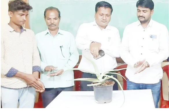
ದಿನಾಚರಣೆಯಲ್ಲಿ ಅವರು ಮಾತನಾಡುತ್ತಿದ್ದರು. ವಿಶ್ವಸಂಸ್ಥೆಯ ಸಾಮಾನ್ಯ ಸಭೆಯ ವ್ಯಕ್ತಿಗಳ ಕಳ್ಳಸಾಗಣೆ ಮತ್ತು