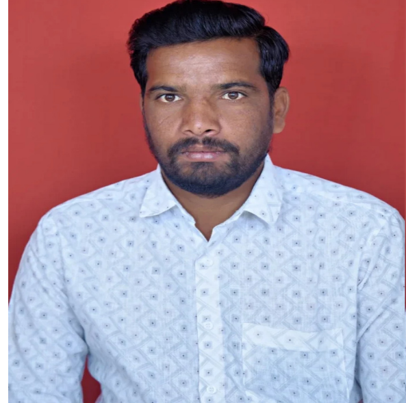
ಚುನಾವಣೆಯಲ್ಲಿ ತಕ್ಕ ಪಾಠ ಕಲಿಸಬೇಕಾಗುತ್ತದೆ ಎಂದು ಎಚ್ಚರಿಕೆ ನೀಡಿದರು.