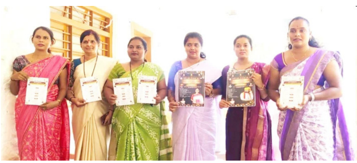
ಉಪಾಧ್ಯಕ್ಷರು ಸೇರಿದಂತೆ ತಾಲೂಕಾ ಮಟ್ಟದ ಅಧಿಕಾರಿಗಳು ಉಪಸ್ಥಿತರಿರುವರು.