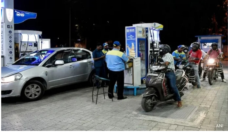
ನವದೆಹಲಿ, ಮಾರ್ಚ್ 27: ತೈಲದ ಮೇಲಿನ ಅಬಕಾರಿ ಸುಂಕವನ್ನು ಕೇಂದ್ರ ಸರ್ಕಾರ ಇಳಿಕೆ ಮಾಡುವ ಮೂಲಕ ಪೆಟ್ರೋಲ್, ಡೀಸೆಲ್ ಬೆಲೆ ಏರಿಕೆಯ ಆತಂಕದಲ್ಲಿ ಜನರಿಗೆ ನಿರಾಶ ನೀಡಿದೆ.

ಮಧ್ಯಪ್ರಾಚ್ಯದಲ್ಲಿ ನಡೆಯುತ್ತಿರುವ ಸಂಘರ್ಷದಿಂದ ಕಚ್ಚಾ ತೈಲ ಬೆಲೆ ಏರಿಕೆಯಾಗಿ ಚಿಲ್ಲರೆ ಮಾರಾಟದ ಪೆಟ್ರೋಲ್ ಮತ್ತು ಡೀಸೆಲ್ ಬೆಲೆ ಏರಿಕೆಯ ಆತಂಕ ಸೃಷ್ಟಿಯಾಗಿತ್ತು. ಆದರೆ ಕೇಂದ್ರ ಸರ್ಕಾರ ತೈಲದ ಅಬಕಾರಿ ಸುಂಕ ಇಳಿಕೆ ಮಾಡುವ ಮೂಲಕ ಬೆಲೆ ಏರಿಕೆ ಹೊರೆಯಿಂದ ಜನರನ್ನು ಮುಕ್ತ ಮಾಡಿದ್ದು, ದೇಶದಲ್ಲಿ ಪೆಟ್ರೋಲ್ ಮತ್ತು ಡೀಸೆಲ್ ದರ ಯಥಾಸ್ಥಿತಿಯಲ್ಲೇ ಮುಂದುವರಿಯಲಿದೆ.