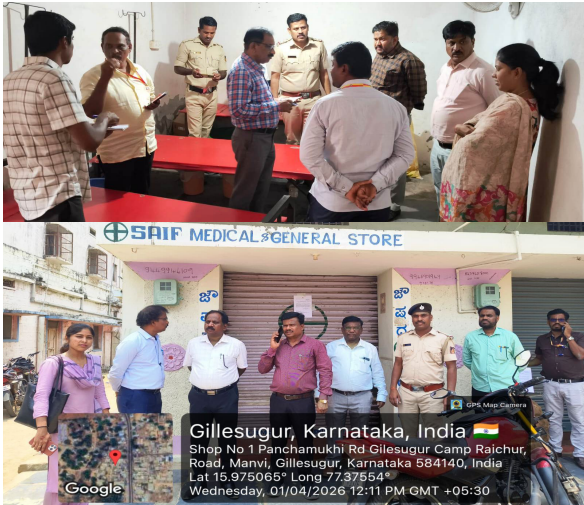
ಮಾಡಿ ದಿನಾಂಕ: 01.04.2026ರಂದು ಏಕಾಕಾಲಕ್ಕೆ ಜಿಲ್ಲಾ ಮಟ್ಟದ ಹಾಗೂ ತಾಲ್ಲೂಕು ಮಟ್ಟದ ಅಧಿಕಾರಿಗಳ ತಂಡವು ಸಕ್ರಿಯವಾಗಿ ಭಾಗವಹಿಸಿ ಈ ವಿಶೇಷ ಕಾರ್ಯಚರಣೆಯಲ್ಲಿ ವಿವಿಧ ಪ್ರದೇಶಗಳಲ್ಲಿ ಒಂದೇ ಸಮಯದಲ್ಲಿ ಅನಧಿಕೃತವಾಗಿ ಕ್ಲಿನಿಕ್ ನಡೆಸುತ್ತಿದ್ದ ನಕಲಿ ವೈದ್ಯರು ಹಾಗೂ ಕೆ.ಪಿ.ಎಂ.ಇ ಕಾಯ್ದೆ ಅಡಿಯಲ್ಲಿ ನೋಂದಣಿಯಾಗದ ಖಾಸಗಿ ಕ್ಲಿನಿಕ್‌ಗಳ ಮೇಲೆ ದಾಳಿ ನಡೆಸಲಾಯಿತು. ಈ ದಾಳಿಯಲ್ಲಿ ವೈದ್ಯಕೀಯ ಅರ್ಹತೆ ಇಲ್ಲದ ಕ್ಲಿನಿಕ್ ನಡೆಸುತ್ತಿದ್ದ ಹಲವಾರು ನಕಲಿ