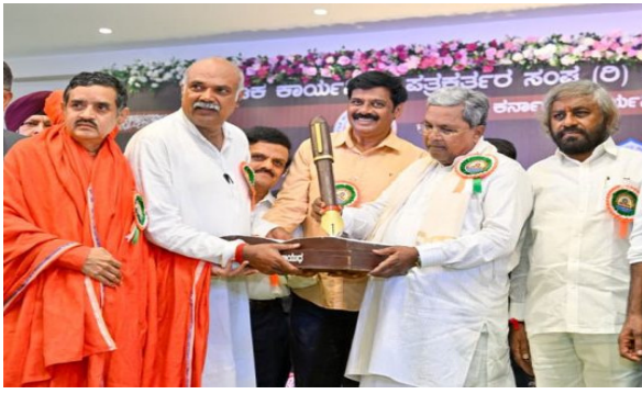
ಬಿಸವಣ್ಣ ತಿರಸ್ಕರಿದ್ದ ಕರ್ಮಸಿದ್ಧಾಂತವನ್ನು ಪಾಲಿಸುವವರು ಈಗ ಹೆಚ್ಚಾಗಿದ್ದಾರೆ. ಈ ಮೌಢ್ಯ ಆಚರಿಸುವವರಲ್ಲಾ ವಿದ್ಯಾವಂತರೇ ಎನ್ನುವುದು ಬೇಸರದ ಸಂಗತಿ ಎಂದರು.

ಬೀದರ್ ವಿ:11: ಸಂವಿಧಾನದ ಆಶಯಗಳನ್ನು ಜಾರಿಗೊಳಿಸುವ ಕೆಲಸ ಮಾಡುತ್ತಿದ್ದೇವೆ ಎಂದು ಪತ್ರಕರ್ತರು ತಮ್ಮನ್ನು ತಾವು ನೋಡಿಕೊಳ್ಳಬೇಕು ಎಂದು ಮುಖ್ಯಮಂತ್ರಿ ಸಿದ್ದರಾಮಯ್ಯ ನುಡಿದರು. ಕರ್ನಾಟಕ ಕಾರ್ಯನಿರತ ಪತ್ರಕರ್ತರ ಸಂಘ ಮತ್ತು ಬೀದರ್ ಜಿಲ್ಲಾ ಕಾರ್ಯನಿರತ ಪತ್ರಕರ್ತರ ಸಂಘ ಆಯೋಜಿಸಿದ್ದ 40ನೇ ರಾಜ್ಯ ಪತ್ರಕರ್ತರ ಸಮ್ಮೇಳನವನ್ನು ಉದ್ಘಾಟಿಸಿ ಮಾತನಾಡಿದರು.