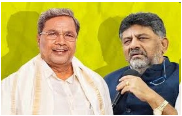
ಪುನಾರಚನೆಗೆ ಅನುಮತಿ ಕೇಳುವ ಸಾಧ್ಯತೆ ಹೆಚ್ಚಿದೆ.

ಬೆಂಗಳೂರು, ಏ. 17- ರಾಜ್ಯ ಕಾಂಗ್ರೆಸ್‌ನಲ್ಲಿ ನಾಯಕತ್ವ ಬದಲಾವಣೆ ವಿಚಾರ ಬಂದಿ ಮುಚ್ಚಿದ ಕೆಂಡದಂತಿದ್ದು, ಸಂಪುಟ ಪುನಾರಚನೆ ಕೂಗು ಬಲವಾಗಿರುವಾಗಲೇ ಮುಖ್ಯಮಂತ್ರಿ ಸಿದ್ದರಾಮಯ್ಯ ಹಾಗೂ ಉಪಮುಖ್ಯಮಂತ್ರಿ ಡಿ.ಕೆ. ಶಿವಕುಮಾರ್ ಇಂದು ದೆಹಲಿಗೆ ತೆರಳಿದ್ದು, ವರಿಷ್ಠರನ್ನು ಭೇಟಿ ಮಾಡಿ ರಾಜ್ಯ ಕಾಂಗ್ರೆಸ್‌ನಲ್ಲಿರುವ ಗೊಂದಲಗಳ ನಿವಾರಣೆ ಸಂಬಂಧ ಚರ್ಚಿಸುವ ಸಾಧ್ಯತೆಗಳಿವೆ.