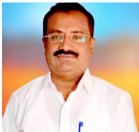
-ಲೇಖನ ಈರೇಶ ಹುಲಗುಂಚಿ ಮಾನವಿ

ಗುರು ಬಸವಣ್ಣರವ ಅಶ್ವಾರೂಢ ಮೂರ್ತಿಯನ್ನು ದೆಹಳಿಯಲ್ಲಿರುವ ಪಾರ್ಲಿಮೆಂಟ್ ನಲ್ಲಿ 27ನೇ ಎಪ್ರಿಲ್ 2003 ರಲ್ಲಿ ಅನಾವರಣಗೊಳಿಸಲಾಯಿತು ನಾವುಗಳು ಬಸವಣ್ಣನವರ ಜಯಂತಿಯನ್ನು ಕೇವಲ ಜಯಂತಿಯನ್ನಾಗಿ ಆಚರಿಸದೆ ಅವರ ಜೀವನವನ್ನು ನಮ್ಮ ಜೀವನವನ್ನಾಗಿ ಮಾಡಿಕೊಳ್ಳಬೇಕು ಬಸವಣ್ಣವರನ್ನು ಮೇರಣಿಗೆಯಲ್ಲಿ ನೋಡದೆ ನಮ್ಮ ನಡುವಳಿಕೆ ನೋಡಬೇಕು. ಬಸವಣ್ಣವರನ್ನು ಕೇವಲ ಮೂರ್ತಿಗಳಲ್ಲಿ ನೋಡಿದ ನಮ್ಮ ಕೃತಿಗಳಲ್ಲಿ ಕಾಣುವಂತಾಗಬೇಕು.