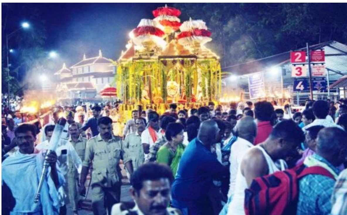
ಉಚಿ: ಧರ್ಮಸ್ಥಳದಲ್ಲಿ ಏ. 14 ರಿಂದ ನಡೆಯುತ್ತಿರುವ ಕಾಲಾವಧಿ ಜಾತ್ರೆ ಪ್ರಯುಕ್ತ ಸೋಮವಾರ ರಾತ್ರಿ ಚಂದ್ರಮಂಡಲ ಉತ್ಸವ ನಡೆಯಿತು. ನಾಡಿನಲ್ಲೆಡೆಯಿಂದ ಸಾವಿರಾರು ಭಕ್ತರು ಉತ್ಸವವನ್ನು ಶ್ರದ್ಧಾ-ಭಕ್ತಿಯಿಂದ ವೀಕ್ಷಿಸಿ ಕಣ್ತುಂಬಿಕೊಂಡರು.