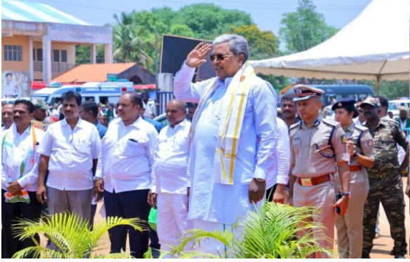
ಜೆ.ಬಿ.ಬಿ. ನಡೆಸುತ್ತೇನೆ ಎಂದು ಅವರು ಹೇಳಿದರು.

ಬೆಂಗಳೂರು, ಏ. 21- ಕೇಂದ್ರದ ಜಾರಿ ನಿರ್ದೇಶನಾಲಯ ಕಾಂಗ್ರೆಸ್ ನಾಯಕರನ್ನು ಗುರಿಯಾಗಿ ದಾಳಿ ನಡೆಸುತ್ತಿದೆ. ಬಿಜೆಪಿ ನಾಯಕರ ವಿರುದ್ಧ ದಾಳಿ ನಡೆಯುತ್ತಿಲ್ಲ ಎಂದು ಮುಖ್ಯಮಂತ್ರಿ ಸಿದ್ದರಾಮಯ್ಯ ಹೇಳಿದರು.