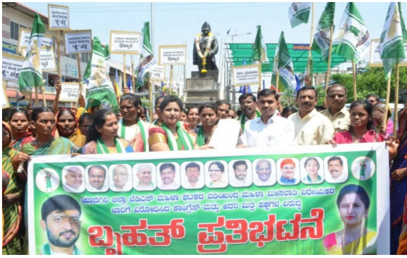
ಕೆಲವು ಪಕ್ಷಗಳ ಮನೋಭಾವದಿಂದ ಈ ಪ್ರಕ್ರಿಯೆಗೆ ಹಿನ್ನೆಡೆಯಾಗಿದೆ. ಮುಂದಿನ ದಿನಗಳಲ್ಲಿ ಮಹಿಳೆಯರು ಇದಕ್ಕೆ ತಕ್ಕ ಉತ್ತರ ನೀಡಲಿದ್ದಾರೆ." ಎಂದು ಎಚ್ಚರಿಸಿದರು.

ದೇಶದಲ್ಲಿ ಮಹಿಳೆಯರು ಸಮ ಪ್ರಮಾಣದಲ್ಲಿ ಇದ್ದರೂ, ರಾಜಕೀಯ ಪ್ರತಿನಿಧಿತ್ವದಲ್ಲಿ ಶೇ.33 ಮೀಸಲಾತಿ ಇನ್ನೂ ಸಾಕಾರವಾಗದಿರುವುದು ದುಃಖಕರ ಸಂಗತಿ ಎಂದು ಹೇಳಿದ ಅವರು, "ಕಾಂಗ್ರೆಸ್ ಪಕ್ಷದ ನಿಲುವು ಹಾಗೂ ಅದಕ್ಕೆ ಬೆಂಬಲ ನೀಡುವ