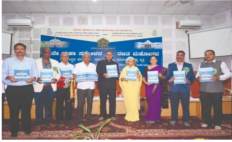
ಮೈಸೂರು: ಏ.24:- ರಾಜಕಾರಣಿಗಳಿಗಿಂತ ದೊಡ್ಡ ನಟರಿಲ್ಲ. ಅವರನ್ನು ಮೀರಿಸಲು ಡಾ.ರಾಜ್‌ಕುಮಾರ್ ಅವರ ನಟನೆಯು ಸಾಕಾಗುವುದಿಲ್ಲ ಎಂದು ಮಾಜಿ ಸಭಾಪತಿ ಕೆ.ಆರ್.ರಮೇಶ್ ಕುಮಾರ್ ವ್ಯಂಗ್ಯವಾದಿದರು.