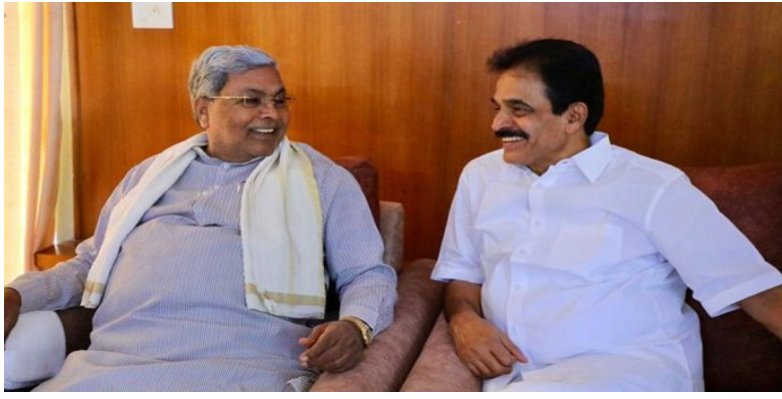
ಸಮಯ ನೀಡಿಲ್ಲ. ಇದರ ಹಿಂದೆ ಕೆ.ಸಿ.ವೇಣುಗೋಪಾಲ್ ಅವರ ಪ್ರಭಾವವಿದೆ ಎಂದು ಹೇಳಲಾಗುತ್ತಿದೆ. ಕೆ.ಸಿ.ವೇಣುಗೋಪಾಲ್ ರಾಜ್ಯ ರಾಜಕಾರಣಕ್ಕೆ ತೆರಳಿದರೆ, ದೆಹಲಿಯಲ್ಲಿ ಸಿದ್ದರಾಮಯ್ಯ ಅವರ ಪರವಾಗಿ ವಹಲತ್ತು ವಹಿಸುವವರು ಇಲ್ಲದಂತಾಗಿ, ಡಿ.ಕೆ.ಶಿವಕುಮಾರ್ ಪರವಾದ ಅಲೆ ಸೃಷ್ಟಿಯಾಗಬಹುದು ಎಂಬ ಚರ್ಚೆಗಳಿವೆ.

ಬೆಂಗಳೂರು, ಮೇ 8- ನೆರೆ ರಾಜ್ಯ ಕೇರಳದಲ್ಲಿನ ಮುಖ್ಯಮಂತ್ರಿ ಆಯ್ಕೆ ಪ್ರಕ್ರಿಯೆಗಳು ರಾಜ್ಯ ರಾಜಕಾರಣದಲ್ಲಿ ಪರಿಣಾಮ ಬೀರುವ ಸಾಧ್ಯತೆಗಳಿವೆ. ಕೇರಳ ರಾಜ್ಯದ ಮುಖ್ಯಮಂತ್ರಿ ರೇಸಿನ್‌ನಲ್ಲಿ ವಿರೋಧ ಪಕ್ಷದ ನಾಯಕ ವಿ.ಡಿ.ಸತೀಶನ್, ಕೆ.ಸಿ.ವೇಣುಗೋಪಾಲ್, ರಮೇಶ್ ಚೆನ್ನಿತ್ತಲ ಹಾಗೂ ಶಶಿತರೂರ್ ಪ್ರಬಲ ಅಕಾಂಕ್ಷಿಗಳಾಗಿದ್ದಾರೆ. ಶಶಿತರೂರ್ ಮತ್ತು ಕೆ.ಸಿ.ವೇಣುಗೋಪಾಲ್ ಸಂಸದರಾಗಿದ್ದು, ಒಂದು ವೇಳೆ ಮುಖ್ಯಮಂತ್ರಿ ಸ್ಥಾನಕ್ಕೆರಿದರೆ, ಲೋಕಸಭೆಗೆ ಉಪಚುನಾವಣೆ ನಡೆಯುವ ಅನಿವಾರ್ಯತೆ ಎದುರಾಗಲಿದೆ.