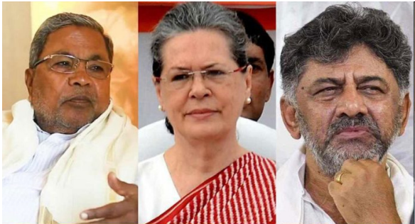
ಪ್ರಿಯಾಂಕ ಗಾಂಧಿ ವಾದ್ಯ ಅವರನ್ನು ಕೇರಳದ ವೈನಾದಿನಿಂದ ಸಂಸದರಾಗಿ ಗೆಲ್ಲಿಸಿ ಕಳುಹಿಸುವಲ್ಲಿ ವೇಣುಗೋಪಾಲ್ ಅವರ ಪಾತ್ರ ಪ್ರಮುಖವಾಗಿತ್ತು.

ಕೆ.ಸಿ.ವೇಣುಗೋಪಾಲ್ ರಾಷ್ಟ್ರ ರಾಜಕಾರಣದಲ್ಲಿ ಮಗ್ಗುಲಾಗಿದ್ದವರು. ಚುವಾವಣೆ ಸಂದರ್ಭದಲ್ಲಿ ಕೇರಳಕ್ಕೆ ಹೆಚ್ಚಿನ ಗಮನ ಕೊಟ್ಟಿದ್ದರು. ತಾವು ಉಸ್ತುವಾರಿ ನಿರ್ವಹಣೆ ಮಾಡಿದ ರಾಜ್ಯಗಳಲ್ಲಿರುವ ತ್ರಿಮಂತ ನಾಯಕರನ್ನು ಸಂಪರ್ಕಿಸಿ ಅವರ ಮೂಲಕ ಕೇರಳ ವಿಧಾನಸಭಾ ಚುನಾವಣೆಗೆ ಸಂಪನ್ಮೂಲ ಕ್ರೋಢೀಕರಿಸಿದ್ದರು. ಲೋಕಸಭೆಯ ವಿರೋಧ ಪಕ್ಷದ ನಾಯಕ ರಾಹುಲ್‌ಗಾಂಧಿ ಮತ್ತು ಎಐಸಿಸಿ ಪ್ರಧಾನ ಕಾರ್ಯದರ್ಶಿ