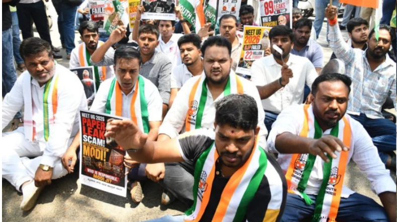
ಮೈಸೂರು: ಮೇ.14:- ನೀಟ್ ಪರೀಕ್ಷೆ ನಡೆಯುವ ಮೊದಲೇ ಪ್ರಶ್ನೆಪತ್ರಿಕೆ ಸೋರಿಕೆ ಆಗಲು ಕೇಂದ್ರ ಸರ್ಕಾರದ ವೈಫಲ್ಯ ಕಾರಣವೆಂದು ಆರೋಪಿಸಿ ಸಂಸದರ ಕಚೇರಿಗೆ ಮುತ್ತಿಗೆ ಹಾಕಲು ಯತ್ನಿಸಿದ ಯುವ ಕಾಂಗ್ರೆಸ್ ಕಾರ್ಯಕರ್ತರನ್ನು ಬಂಧಿಸಿ ಬಿಡುಗಡೆಗೊಳಿಸಿದರು.