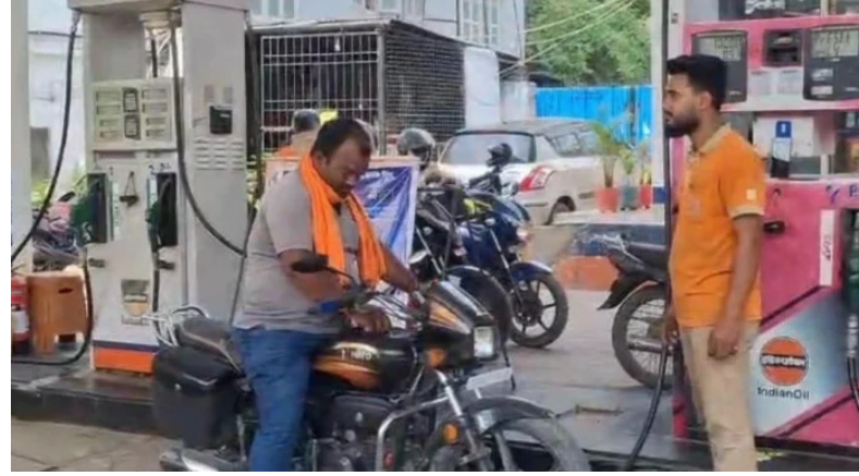
ನವದೆಹಲಿ,ಮೇ.14- ಮಧ್ಯಪ್ರಾಚ್ಯ ಬಿಕ್ಕಟ್ಟು ದೀರ್ಘಕಾಲದವರೆಗೆ ಮುಂದುವರಿದರೆ ಕೇಂದ್ರ ಸರ್ಕಾರ ಪೆಟ್ರೋಲ್ ಮತ್ತು ಡೀಸೆಲ್ ಬೆಲೆಗಳನ್ನು ಹೆಚ್ಚಿಸಬೇಕಾಗಬಹುದು ಎಂದು ಭಾರತೀಯ ರಿಸರ್ವ್ ಬ್ಯಾಂಕ್ ಗವರ್ನರ್ ಸಂಜಯ್ ಮಲ್ಹೋತ್ರಾ ಮುನ್ಸೂಚನೆ ನೀಡಿದ್ದಾರೆ.

ಅಲ್ಲಿಂದ ಸತತ ಆರು ಬಾರಿ ತರವೂರು ಕ್ಷೇತ್ರದಿಂದಲೇ ಗೆಲುವು ಸಾಧಿಸಿದ್ದರು. 2021 ರಲ್ಲಿ ಅವರು ಕೇರಳಂನ ವಿಧಾನಸಭೆಯ ವಿರೋಧ ಪಕ್ಷದ ನಾಯಕರಾಗಿ ಆಯ್ಕೆಯಾಗಿದ್ದರು. ವಿರೋಧ ಪಕ್ಷದ ನಾಯಕರಾಗಿ ಅವರು ಕೇರಳಂನಲ್ಲಿ ವ್ಯಾಪಕ ಪ್ರವಾಸ ನಡೆಸಿ ಎಡ ಪಕ್ಷಗಳ ದುರಾಡಳಿತ ವಿರುದ್ಧ ಜಾಗೃತಿ ಮೂಡಿಸಿ ಕಾಂಗ್ರೆಸ್ ಪಕ್ಷವನ್ನು ಚುನಾವಣೆಯಲ್ಲಿ ಗೆಲ್ಲಿಸಲು ಶ್ರಮಿಸಿದ್ದರು. ನೂತನ ಮುಖ್ಯಮಂತ್ರಿ ವಿ.ಡಿ.ಸತೀಶನ್ ಅವರು 1954 ರಲ್ಲಿ ಹುಟ್ಟಿದ್ದು, ಅವರಿಗೆ ಈಗ 62 ವರ್ಷ.