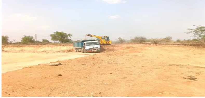
ಮೌನ ವಹಿಸಿರುವುದು ಹಲವು ಅನುಮಾನಗಳಿಗೆ ಕಾರಣವಾಗಿದೆ. ಕೂಡಲೇ ಸ್ಥಳಕ್ಕೆ ಭೇಟಿ ನೀಡಿ ಪರಿಶೀಲನೆ ನಡೆಸಿ, ಕಾನೂನು ಉಲ್ಲಂಘನೆ ಮಾಡಿದವರ ವಿರುದ್ಧ ಕಠಿಣ ಕ್ರಮ ಕೈಗೊಳ್ಳಬೇಕು” ಎಂದು ಒತ್ತಾಯಿಸಿದರು.