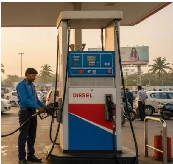
ಕಂಡಿದ್ದು, ಕೋಲ್ಕತ್ತಾದಲ್ಲಿ ಲೀಟರ್‌ಗೆ 95.13 ರೂ., ಮುಂಬೈನಲ್ಲಿ 93.14 ರೂ. ಮತ್ತು ಚೆನ್ನೈನಲ್ಲಿ 95.25 ರೂ.ಗಳಿಗೆ ಏರಿಕೆ.

ಡೀಸೆಲ್ ಬೆಲೆಗಳು ಸಹ ಮಹಾನಗರಗಳಲ್ಲಿ ತೀವ್ರ ಏರಿಕೆ