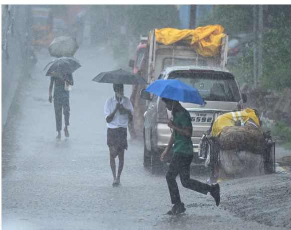
ಬೆಂಗಳೂರು, ಗದಗ, ಹಾವೇರಿ ಮತ್ತು ಬಾಗಲಕೋಟೆಯಲ್ಲಿ ಗಂಟೆಗೆ 40 ರಿಂದ 50 ಕಿ.ಮೀ ವೇಗದಲ್ಲಿ ಗಾಳಿ ಬೀಸುವ ಸಾಧ್ಯತೆ ಇದೆ ಮತ್ತು ಕೆಲವು ಸ್ಥಳಗಳಲ್ಲಿ ಮಧ್ಯಮ ಮಳೆಯಾಗುವ ಸಾಧ್ಯತೆ ಇದೆ.

ಬೆಂಗಳೂರು,ಮೇ.20- ಮುಂದಿನ 7 ದಿನಗಳವರೆಗೆ ರಾಜ್ಯಾದ್ಯಂತ ಗುಡುಗು, ಮಿಂಚು ಮತ್ತು ಗುಡುಗು ಸಹಿತ ಮಳೆಯಾಗುವ ಸಾಧ್ಯತೆ ಇದೆ ಎಂದು ಹವಾಮಾನ ಇಲಾಖೆ ಎಚ್ಚರಿಕೆ ನೀಡಿದೆ. ಮೇ 20 ರಿಂದ 26 ರವರೆಗೆ ರಾಜ್ಯದ ಹೆಚ್ಚಿನ ಜಿಲ್ಲೆಗಳಲ್ಲಿ ಮಳೆಯಾಗುವ ಸಾಧ್ಯತೆ ಇದೆ ಎಂದು ಹವಾಮಾನ ಇಲಾಖೆ ತಿಳಿಸಿದೆ.