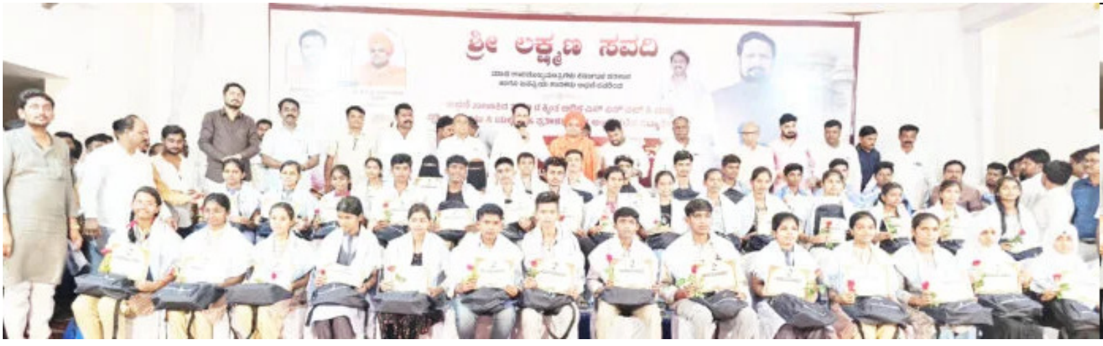
ಶಿಕ್ಷಣದ ಕೊರತೆಯೇ ಪ್ರಮುಖ ಕಾರಣವಾಗಿದ್ದು, ಪ್ರತಿಯೊಬ್ಬರೂ ಶಿಕ್ಷಣದ ಸದುಪಯೋಗ ಮಾಡಿಕೊಳ್ಳಬೇಕು ಎಂದರು.

ಅರ್ಥಣಿ : ಮೇ.25: ವಿದ್ಯಾರ್ಥಿಗಳು ವಿದ್ಯೆಯ ಜೊತೆಗೆ ಪರಿಶ್ರಮ, ಸಂಯಮ, ಸಂಸ್ಕಾರ, ಶಿಸ್ತು ಹಾಗೂ ಮಾನವೀಯ ಮೌಲ್ಯಗಳನ್ನು ರೂಢಿಸಿಕೊಳ್ಳಬೇಕು, ತಂದೆ ತಾಯಿ, ಗುರು ಹಿರಿಯರನ್ನು ಗೌರವಿಸಬೇಕು. ಸತತ ಅಧ್ಯಯನದ ಮೂಲಕ ಉತ್ತಮ ಸಾಧನೆ ಮಾಡಬೇಕು. ಜೀವನದ ಯಶಸ್ಸಿಗೆ ಶಿಕ್ಷಣವೇ ಪ್ರಮುಖ ಅಸ್ತ್ರವಾಗಿದೆ. ಗ್ರಾಮೀಣ ಭಾಗದ ವಿದ್ಯಾರ್ಥಿಗಳು ಲಭ್ಯವಿರುವ ಅವಕಾಶಗಳನ್ನು ಸದುಪಯೋಗಪಡಿಸಿಕೊಂಡು ಉನ್ನತ ಗುರಿಗಳನ್ನು ಸಾಧಿಸಬೇಕು ಎಂದು ಮಾಜಿ ಉಪಮುಖ್ಯಮಂತ್ರಿ ಹಾಗೂ ಶಾಸಕ ಲಕ್ಷ್ಮಣ ಸವದಿ ಹೇಳಿದರು. ಅವರು ತಾಲೂಕಿನ ಹಲ್ಲಾ ರೈತ ಸಭಾಭವನದಲ್ಲಿ ಹಮ್ಮಿಕೊಂಡಿದ್ದ ಅರ್ಥಣಿ ತಾಲೂಕಿನ ಎಸ್.ಎಸ್.ಎಲ್.ಸಿ. ಮತ್ತು ದ್ವಿತೀಯ ಪಿಯುಸಿಯಲ್ಲಿ ಶೇ. 85 ಕ್ಕಿಂತ ಹೆಚ್ಚು ಅಂಕ ಪಡೆದ ಸುಮಾರು 2000ಕ್ಕೂ ಹೆಚ್ಚು ಪ್ರತಿಭಾವಂತ ವಿದ್ಯಾರ್ಥಿಗಳಿಗೆ ಪ್ರತಿಭಾ ಪುರಸ್ಕಾರ ನೀಡುವ ಭವ್ಯ ಕಾರ್ಯಕ್ರಮದ ಅಧ್ಯಕ್ಷತೆ ವಹಿಸಿ ಮಾತನಾಡುತ್ತಿದ್ದರು. ವಿದ್ಯಾರ್ಥಿಗಳು ಕಠಿಣ ಪರಿಶ್ರಮ ಮತ್ತು ಸಂಸ್ಕಾರದೊಂದಿಗೆ ಉತ್ತಮ ಶಿಕ್ಷಣ ಪಡೆದು ನಾಡಿಗೆ ಕೀರ್ತಿ ತರಬೇಕು, ನಿಮ್ಮ ತಂದೆ-ತಾಯಿಯರ ಕನಸುಗಳನ್ನು ನನಸು ಮಾಡುವ ಜವಾಬ್ದಾರಿ ನಿಮ್ಮ ಮೇಲಿದೆ. ಮಕ್ಕಳಿಗೆ ಗುಣಮಟ್ಟದ ಶಿಕ್ಷಣ ನೀಡಲು ಜಿಲ್ಲಾ ಮಟ್ಟದಲ್ಲಿ ಇರುವಂತಹ ಶಾಲೆ, ಕಾಲೇಜುಗಳು ನಮ್ಮ ತಾಲೂಕಿನಲ್ಲಿವೆ. ಇಡೀ ರಾಜ್ಯವೇ ನಮ್ಮ ತಾಲೂಕಿನ ಕಡೆ ನೋಡುವಂತಾಗಿದೆ ಎಂದರು.