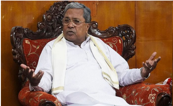
ಬಾಗಿಲಿಗೆ ಹೋದಾಗಲೂ ಕೈಗೆ ಸಿಗದೇ ತಪ್ಪಿಸಿಕೊಳ್ಳುವ ಮೂಲಕ ಉದ್ಭೂತನ ಪ್ರದರ್ಶಿಸಿದರು.