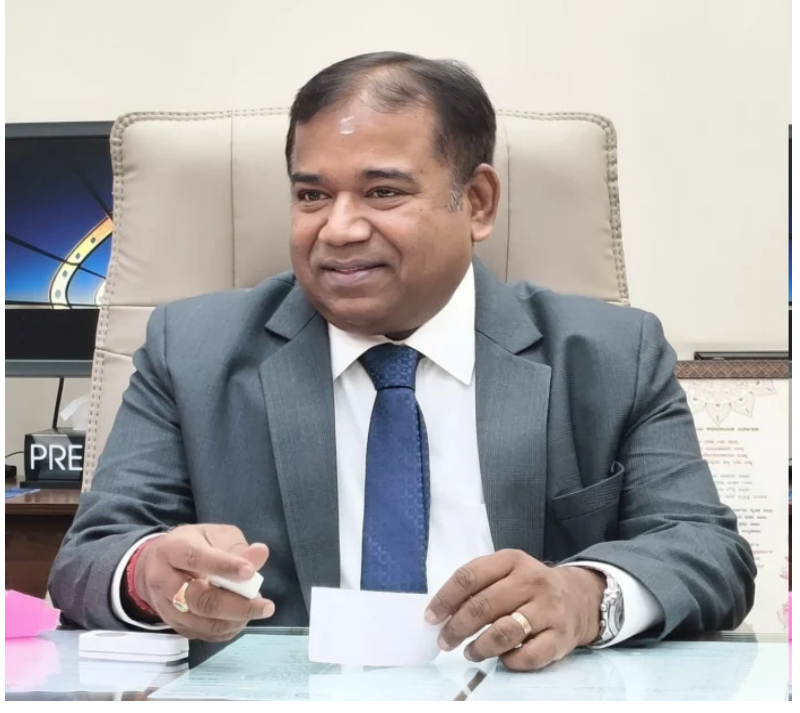
ತಿಂಗಳಲ್ಲಿ ಜಯದೇವ ಹೃದ್ಯೋಗ ಘಟಕ ಪ್ರಾರಂಭಿಸಲಾಗುತ್ತಿದೆ. ಮೈಸೂರಿನಲ್ಲಿ 200 ಹಾಸಿಗೆ ಹೆಚ್ಚುವರಿ ಕಟ್ಟಡಕ್ಕೆ 1 ತಿಂಗಳಲ್ಲಿ ಶಂಕಸ್ಥಾಪನೆ ಮಾಡುತ್ತೇವೆ. ಸೆಪ್ಟೆಂಬರ್‌ನಲ್ಲಿ ಹುಬ್ಬಳ್ಳಿಯಲ್ಲಿ 437 ಹಾಸಿಗೆ ಸಾಮರ್ಥ್ಯದ ಹೃದ್ಯೋಗ ಆಸ್ಪತ್ರೆ ಸಾರ್ವಜನಿಕರ ಸೇವೆಗೆ ಸಿದ್ಧವಾಗುತ್ತಿದೆ ಎಂದರು.

ಆಗ ಮಾತ್ರ ಉತ್ತಮವಾದ ಆರೋಗ್ಯಕರ ಸಮಾಜ ನಿರ್ಮಾಣ ಮಾಡಲು ಸಾಧ್ಯ ಎಂದು ಅವರು ಬೆಂಗಳೂರಿನ ಗೋವಿಂದರಾಜನಗರ, ಚರಕ ಆಸ್ಪತ್ರೆಗಳಲ್ಲಿಯೂ 3