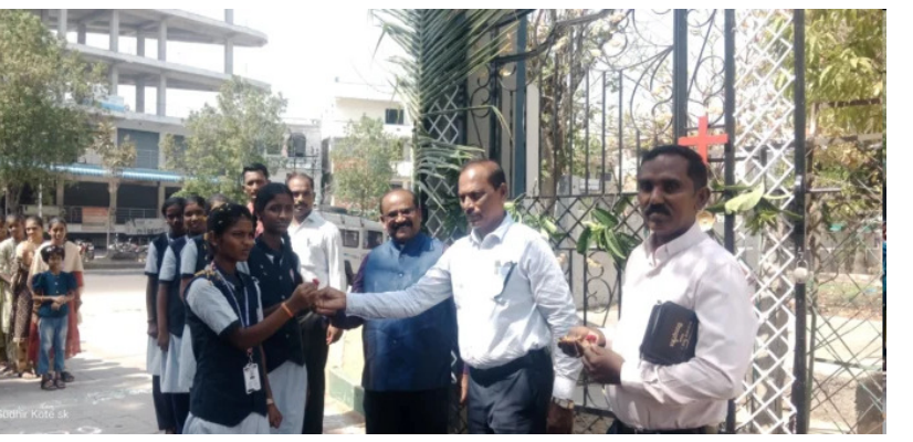
ಗುರಿಗಳನ್ನು ಸಾಧಿಸುವ ಕುರಿತು ಅಮೂಲ್ಯ ಸಲಹೆಗಳನ್ನು ನೀಡಿ ಪ್ರೇರಣಾದಾಯಕ ಸಂದೇಶ ನೀಡಿದರು.